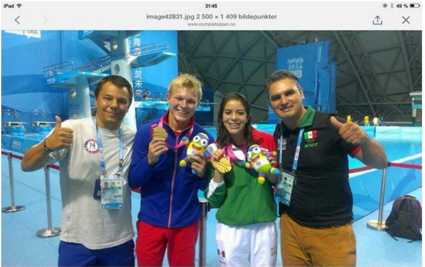
Stolte trenere og stupere etter medaljesermonien 😊