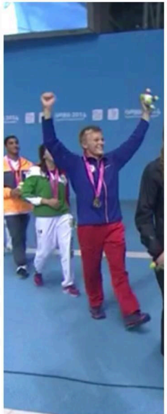
Glade stupere, glade trenere. Jubelen stod i taket